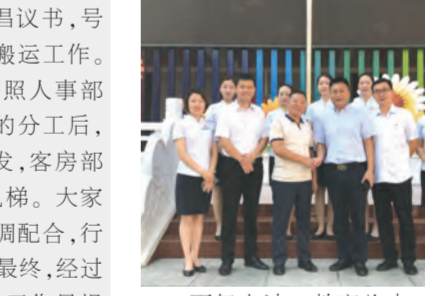
百年大计,教育为本。教育大计,教师为本。为庆祝新中国七十华诞,弘扬新时代尊师风尚,在第35个教师节即将到来之际,9月6日上午,集团党办副主任、河南中州皇冠贸易有限公司代表一行来到金水区经三路小学,向辛勤耕耘在教育战线上的老师们送上慰问品,致以浓浓关怀与节日问候。

在此次慰问活动中,校长张介绍了学校的情况,中州皇冠贸易表示将一如既往地关注、支持学校的发展,履行社会责任,向付出辛苦劳动的老师们送上节日的慰问和祝福,祝愿教师们节日快乐,工作顺利,家庭幸福。河南中州皇冠贸易有限公司多年来始终积极参与社会公益活动,为构建和谐社会添砖加瓦,本次组织参与慰问活动,旨在借此机会,推动公司精神文明建设和社会公益发展,让更多的企业都能参与到支持教育事业发展中来。(贸易公司)