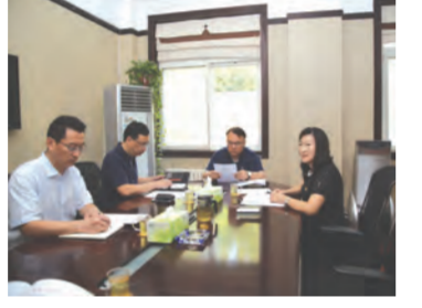
硬较真,把平时不敢说,不好意思说的批评的话和建议的想法,都通过谈心的形式和机会说出来。四是紧扣民主生活会的主题,按照把班子摆进去、把职责摆进去、把自己摆进去的原则,认真查找存在问题,深刻剖析思想根源,首先是把“自己摆”进去,只有把自己摆进去了,责任自然明确了,当你肩上担着责任时,你就有了主动性,就有工作的拼劲,就能有办法解决问题,就能明确努力的方向,拿出整改的好办法和好措施。

按照《中共河南省接待办公室委员会“不忘初心、牢记使命”专题民主生活会方案》要求,8月31日,集团召开“不忘初心、牢记使命”主题教育民主生活会。集团党委班子成员一致认同,开展“不忘初心、牢记使命”主题教育,使全体党员干部特别是党委委员和支部委员们通过学习,更深刻理解了习近平新时代中国特色社会主义思想,更加坚定“四个自信”,筑牢“四个意识”,坚决做到“两个维护”。