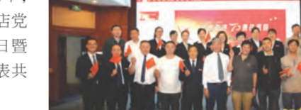
主题党日在酒店八方厅一片欢欣鼓舞的气氛中开始了,宴会上摆满了酒店为过生日的员工精心准备的美食、水果、生日礼物以及“传递美好”员工生日大蛋糕。活动现场开展了一场别开生面的主题党日生日会。

每月为当月过生日的员工举办集体生日会一直是酒店的传统文化,这次生日会正值喜迎建国70周年,按照集团党委关于开展庆祝建国70周年活动的部署,中州皇冠假日酒店党支部把为祖国过生日与为员工庆生融入到一起,组织开展了一场别开生面的主题党日生日会。