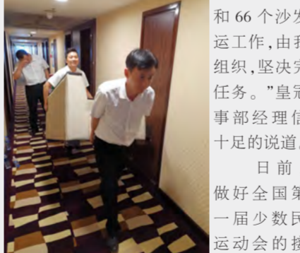
“这66张床和66个沙发搬运工作,由我来组织,坚决完成任务。”皇冠人事部经理信心十足的说道。

日前,为做好全国第十一届少数民族运动会的接待工作,中州假日宾馆二楼房间的床铺需要搬运到智选假日酒店使用,智选房间里面的沙发需要腾出位置,搬运强度很大,为给酒店节省请外部人员搬运的费用,酒店管理层发出“部门大团结,共同来参与”倡议书,号召大家踊跃报名,积极参与这次搬运工作。酒店各部门通知后,立即响应,按照人事部的要求按时集合,大家明确自己的分工后,立即分头行动,搬床、运输、挪沙发,客房部和前台的员工全力配合开门、按电梯。大家干起活来一点都不含糊,相互协调配合,行动快捷有序,个个累得汗流浹背。最终,经过大家的不懈努力,预计五个小时的工作量提前两个小时完成。这一行动也收到酒店外方总经理的高度赞扬。