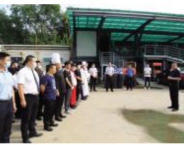
皇冠西停车场补种植被工作顺利完成

通过本次安全考核, 一方面提高了广大干部职工的安全意识, 将安全意识贯彻到生产生活、接待服务、经营管理等方面。另一方面提高广大员工处置突发事件的应急能力。遇到突发事件保持清醒, 沉着冷静, 科学施策, 按照既定预案正确处理应急事件, 为集团接待服务经营发展提供安全保障。(安全部)