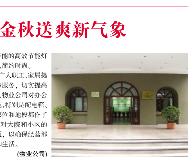
整修改变正当时 金秋送爽新气象

为迎接中秋、国庆双节的到来, 更好地完成国家网络安全周及金鸡百花奖活动的接待活动, 2020年9月12日至14日, 集团工程部对皇冠西停车场枯死的铺地柏、丰花月季进行铲除, 重新补种了四季常青、叶色亮绿的大叶黄杨、瓜子黄杨和色彩多变、颜色艳丽的红叶石楠。皇冠西停车场南北长34米, 东西宽26米, 种植区域分布在停车场四周, 呈环带状布局。此次重新补种的植被最外圈为瓜子黄杨, 中间为红叶石楠, 最内圈为大叶黄杨。举目望去, 那层层叠叠的浅绿、红绿、翠绿, 错落有致, 生机盎然, 热情迎接八方宾客的到来。(工程技术部)